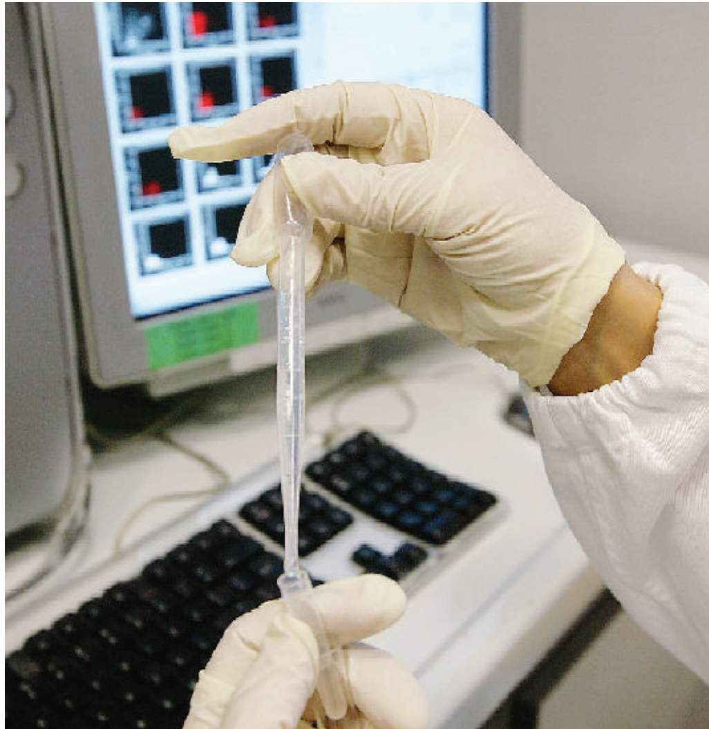
La ricerca medica di frontiera si basa sempre di più sui super-poteri della matematica applicata

«Immaginiamo un insieme di cellule e pensiamo a loro come particelle. Le loro proprietà fisiche possono essere descritte attraverso i paradigmi sviluppati dalla meccanica statistica, ad esempio dalla teoria cinetica dei gas. Parafrasando il Nobel per la Medicina Leland Hartwell, possiamo dire che la modellizzazione dei sistemi viventi pone problemi specifici ri-